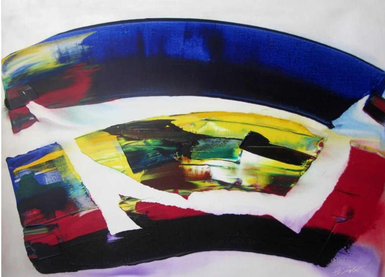
Acrylique sur toile 97 x 130 cm