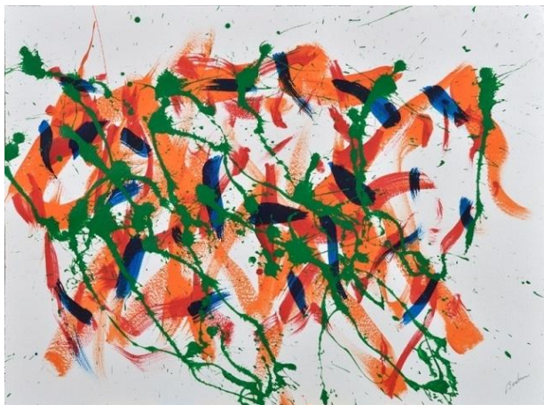
Vent nocturne , 2007 - acrylique sur papier, 46 x 60 cm - Photo Daniel Roussel Exposition : Escapades dans les Laurentides Musée d'art contemporain des Laurentides, 2012