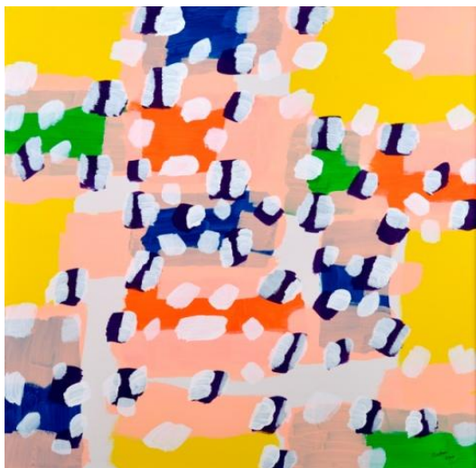
Les canards s'envolent , 2008 – acrylique sur toile – 91,4 x 91,4 cm

J'avais vu trop de gens doués renoncer à l'art parce qu'ils manquaient d'impulsion intérieure. Extrait de l'autobiographie de Thomas Hart Benton, professeur de Pollock à l'Art Students League de New York dans les années 30.