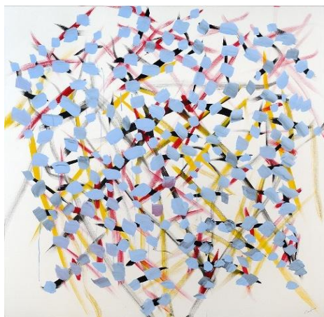
Bleu rythmique , 2010 – acrylique sur toile - 138 x 138 cm

L'action de Marcel Barbeau est authentiquement d'avant-garde, née d'une libération de l'art, de la société et du passé. Ce qui se joue sur la toile c'est un effort sincère de transcrire son expérience.