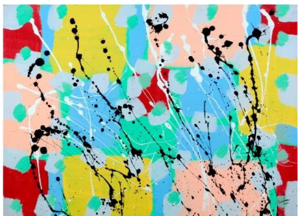
Beauté convulsive , 2012, acrylique sur toile – 46 x 61 cm

Dès 1944, Marcel Barbeau a connaissance des procédés expérimentaux des surréalistes.