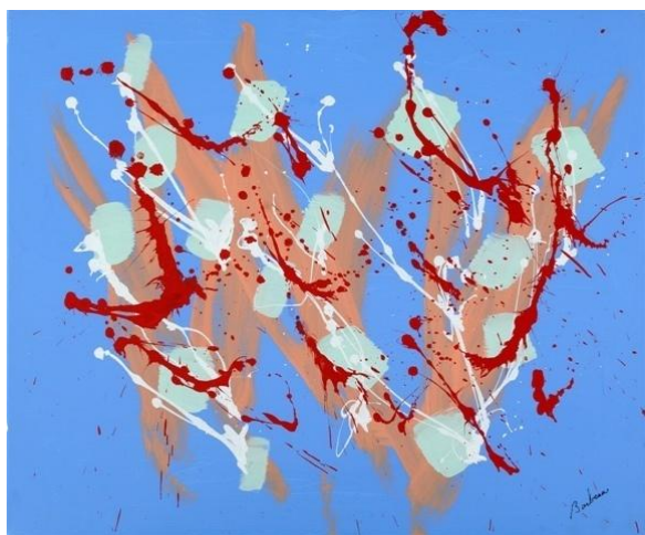
Fêtes galantes , 2011, acrylique sur toile – 51 x 61 cm